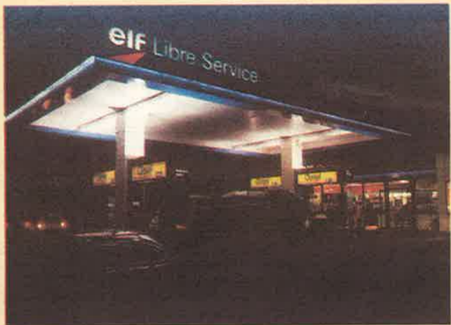
▲ Station service Elf du 103 Boulevard de Suisse, à Toulouse.

Le 6 janvier dernier, une station service Elf a été le théâtre d'événements étranges. Lumières bleutées irréelles et apparitions dans la brume avaient de quoi inquiéter mais ce n'était que du cinéma ! De 6 heures du matin à 22 heures, caméra et projecteurs ont en effet été braqués sur la boutique et la « piste » de la station.