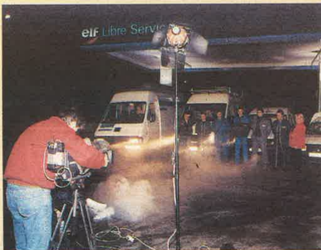
▲ Pendant le tournage (Film réalisé par Funambule Production)

DAISY, l'outil de gestion et de contrôle indispensable